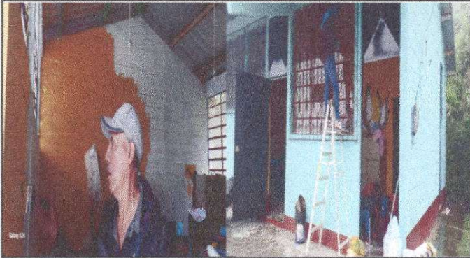
Foto 1: Pintura en la parte interna y externa de la escuela y colocación de un Timbre en un 25% de avance.