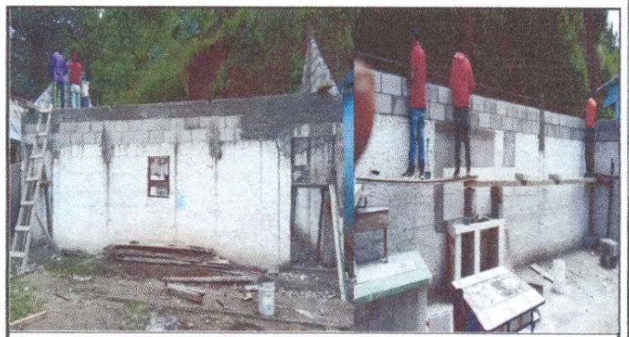
Foto 6: Colocación de carrileras de block, repello y cernido de pared en un 30% de avance.

Observación: Si es necesario se pueden agregar hojas adicionales y actualizar el número de hojas.