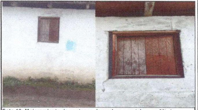
Foto 10: Mejoramiento de ventanas de madera a metal en un 0% de avance.