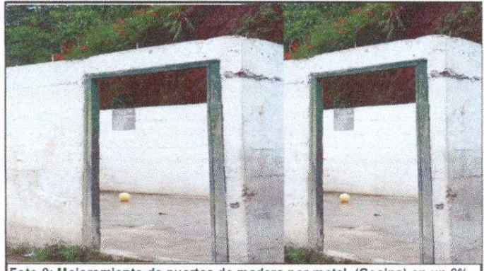
Foto 9: Mejoramiento de puertas de madera por metal. (Cocina) en un 0% de avance.