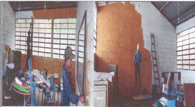
Foto 3: Pintura interna del edificio escolar y mejoramiento de alumbrado eléctrico en un 25% de avance.